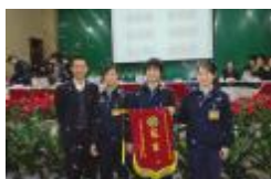
庄培副总裁为冠军颁奖