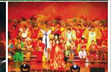
“奋勇拼搏，迈向2009”——格力电器迎新年团拜会掠影