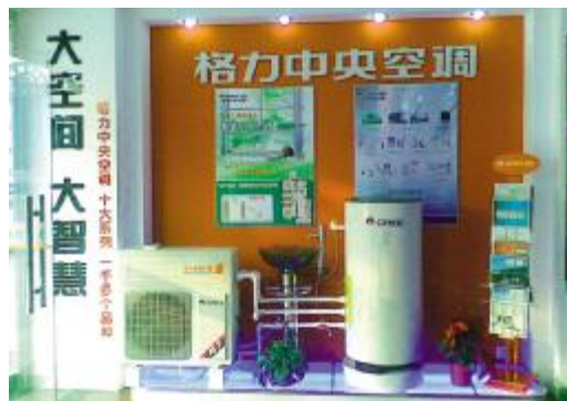
图为新开业的格力空调松江专卖店内部

该旗舰店秉承“环境更舒适、品种更齐全、安装更专业、服务更周到”的“四个更”理念,在占地120多平方米的展厅内设有中央空调展示区、热泵热水器展示区、家用空调“精品节能”专区、零部件展示区、小家电展示区、企业文化展示区、样板工程展示区等,让消费者更直观更全面更深入的了解“格力”品牌的深厚底蕴,又为消费者提供更齐全、品质更好的格