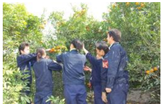
图为格力电器员工在果园采摘“爱心橘”

格力电器在做强做大的同时，始终不忘社会责任，截至目前，格力电器已累计向社会公益性捐款捐物近1亿元。